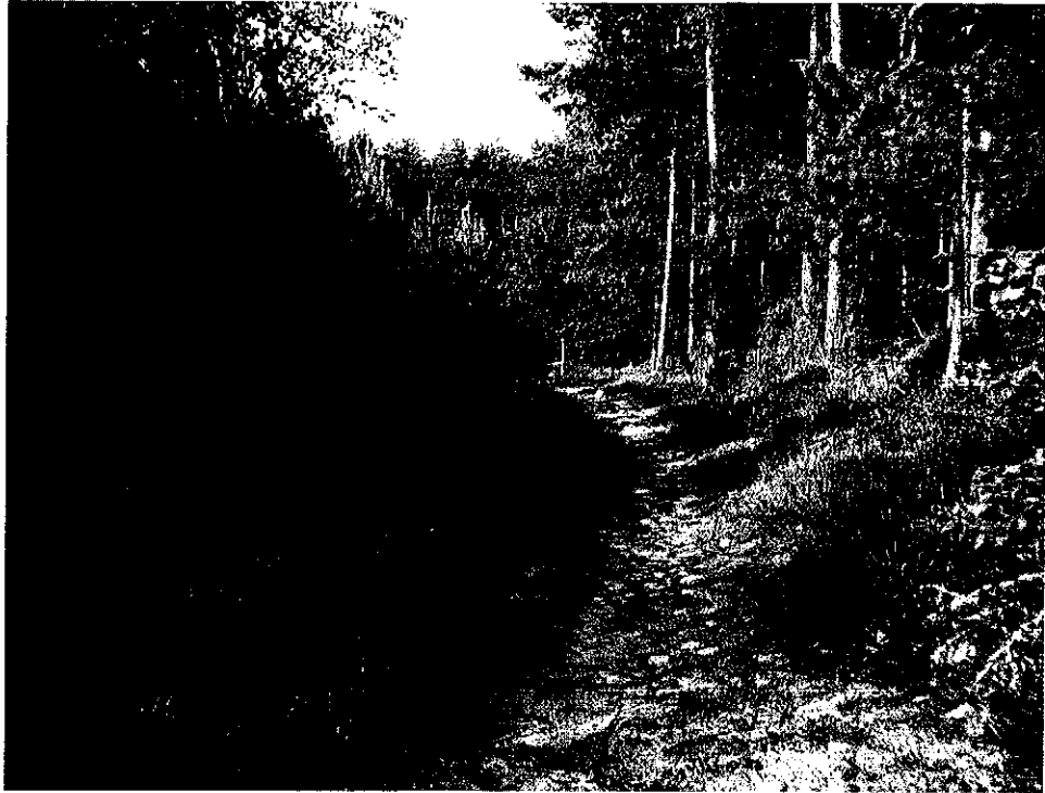
Urokliwe ścieżki leśne i unikatowe wrzosowiska