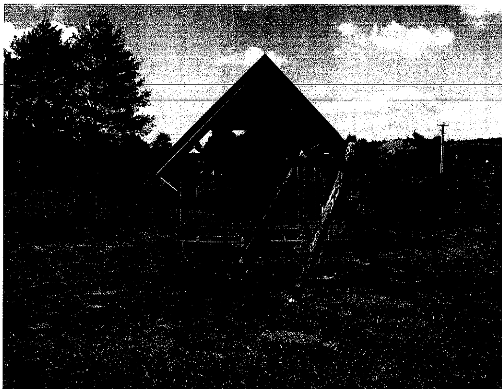
Plac rekreacyjny przy jeziorze w Nowej Wsi

Głównym elementem krajobrazu są lasy, wśród których przeważają bory sosnowe, z którymi wiąże się występowanie rozległych borówczysk. Obfitość owoców leśnych i grzybów zachęca do długich spacerów. Duża lesistość wpływa na wysoką liczebność zwierzyny – dziki, jelenie, sarny – tutejsze lasy to raj dla myśliwych. W środku Nowej Wsi znajduje się małe jezioro o powierzchni 7,32 ha, u brzegów którego położone są zagrody wiejskie.