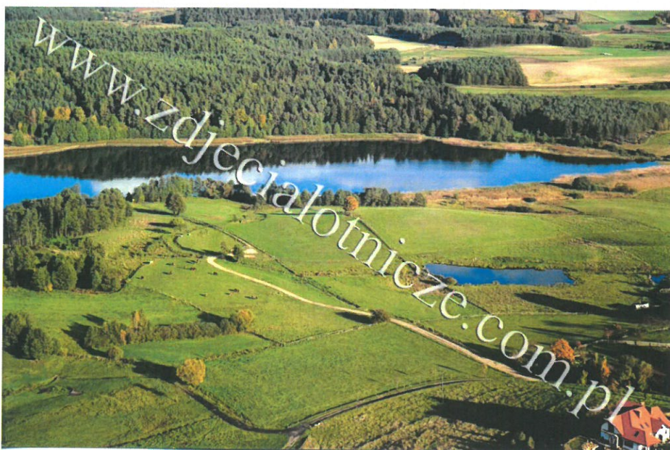
Widok na jezioro Żukowskie