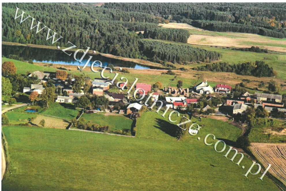
Widok z lotu ptaka na Jamno

Miejscowość oczarowuje przybyszy malowniczością, różnorodnością rzeźby terenu oraz gatunków roślinności.