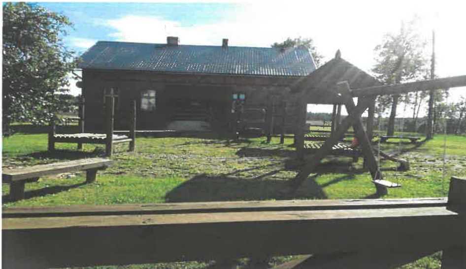
Ryc. 3. Chośnica – plac zabaw przy budynku byłej szkoły w Chośnicy