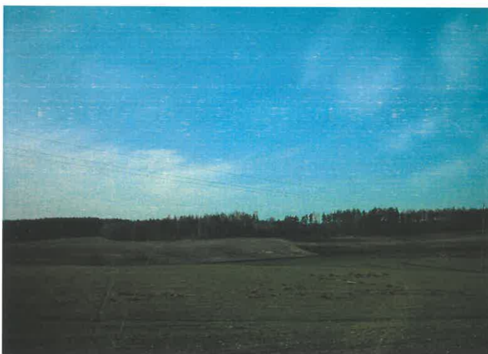
Ryc. 1. Chośnica - widok

Siedzibą sołectwa jest Chośnica. W skład sołectwa wchodzi miejscowości Bawernica, Chałupa i Folwark. We wsi Bawernica, jak i w Chośnicy występuje zwarta zabudowa kilku siedlisk, pozostałe rozproszone są w okolicy, w formie wybudowań (niekiedy w dość sporych odległościach od siebie). Wsie typowo rolnicze, gospodarstwa średnie i indywidualne.