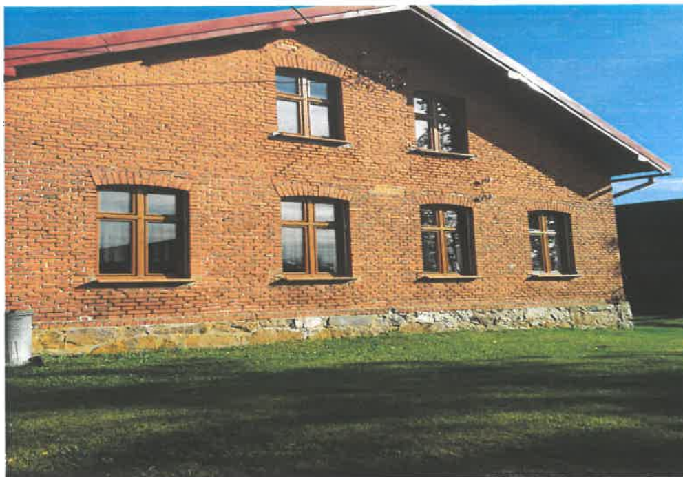
Ryc. 4. Chośnica – budynek byłej szkoły w Chośnicy – widok od strony szczytu