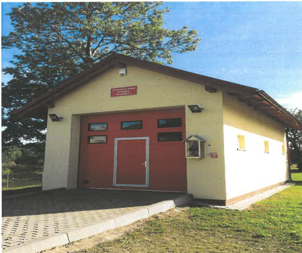
Ryc. 2. Chośnica – Ochotnicza Straż Pożarna